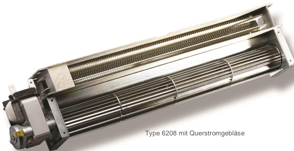
Type 6208 mit Querstromgebläse