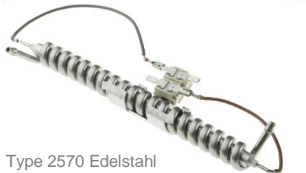
Type 2570 Edelstahl