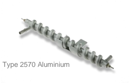
Type 2570 Aluminium